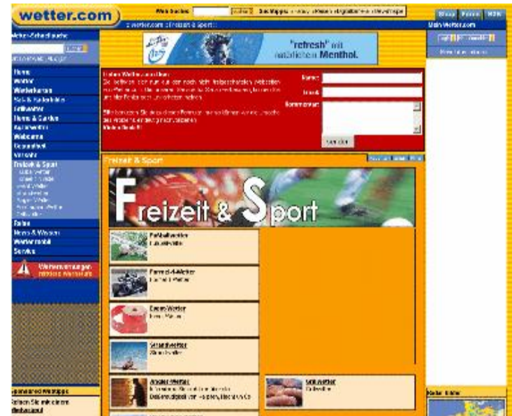
Kunde „Nivea“ Selbstbräuner