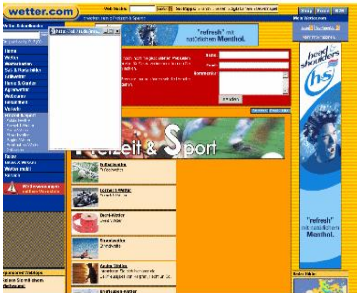
Kunde „Nivea“ Selbstbräuner

Die Werbemittel werden in diesem Beispiel ausgeliefert, wenn die Targetingkriterien vom Adserver (Bild + Temperaturmeldung) aufgerufen werden.